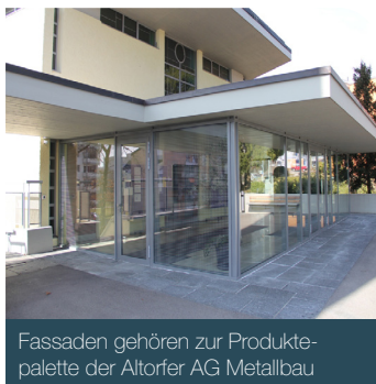
Fassaden gehören zur Produktpalette der Altorfer AG Metallbau

Das VPportal macht die BRZ-Ressourcenplanung mobil nutzbar. Die Mitarbeiter in der Werkstatt sehen jederzeit, welcher Monteur welchem Projekt zugeteilt ist. Überdies auch wann und wie lange. Das Layout erinnert an eine klassische Plantafel.