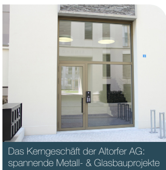
Das Kerngeschäft der Altorfer AG: spannende Metall- & Glasbauprojekte