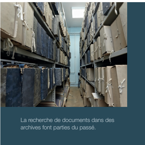
La recherche de documents dans des archives font parties du passé.

Processus efficaces grâce à une administration svelte.